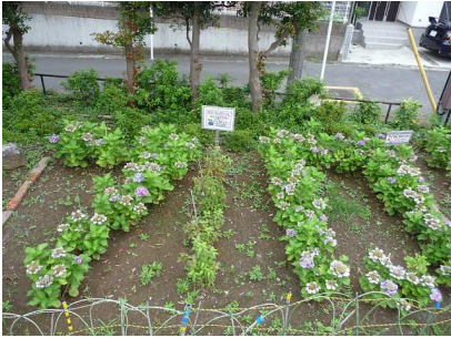
70周年の70と書いてあります