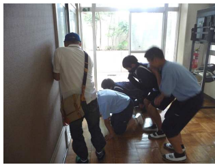
身を低くして煙の中へ

り運ぶ訓練が行われました。生徒たちは担当者から説明を聞いた後、てきぱきと体験していました。中庭では、消火訓練です。女性消防団の説明を真剣に聞いたり、質問に答えていました。訓練では、大きな声で「火事だ！」と言い、敏速な行動で消火していました。