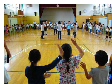
7/16~18 高田小学校の練習