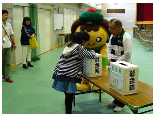
たかたんも受付お手伝い