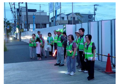
他の参加者を待つ出発前

人通りや植え込みなどの状況を確認し合ったり、普段なかなか会えない方との会話にも花が咲いていました。スタートの時間にパラパラと小雨が降ってきましたが、最後までパトロールを行う事ができました。