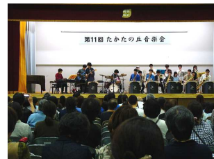
慶応大学生ジャズバンド

サックスの演奏では中学ブラスバンド部が、大学生のジャズではサックスグループが立ち止まり耳を澄ましていたのが印象的でした。