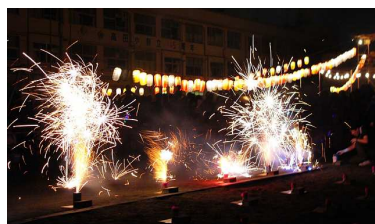
高田地域ケアプラザの花火

小型台風接近で心配しましたが、無事開催できました。子供に法被を貸与し、櫓の上で高田音頭を踊ってもらったので、張り切る子が多くみられました。来場者、踊り手とも昨年より多い大会となりました。