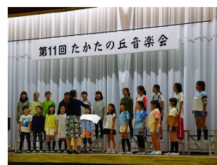
澄んだ歌声 高田小

雅楽、幼稚園児の可愛い歌声、2校の小学生の澄み渡るコーラス。大学のビックバンドによるジャズ。中学生のブラスバンドと実に多彩でした。そして合間合間は昔懐かしい曲、子供向けの曲、ムード溢れる曲などをサックスグループが聞かせてくれました。