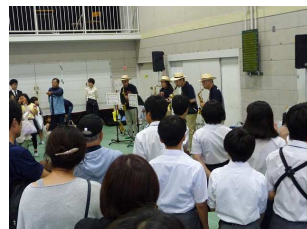
ザ・ハッピーサックス