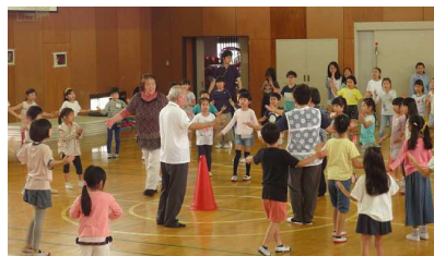
7/12 高田東小学校の練習

小型台風接近で心配しましたが、無事開催できました。子供に法被を貸与し、櫓の上で高田音頭を踊ってもらったので、張り切る子が多くみられました。来場者、踊り手とも昨年より多い大会となりました。