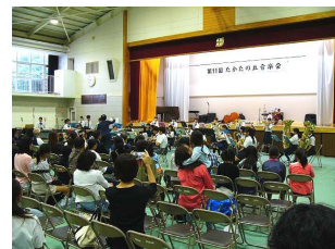
高田中学校吹奏楽部