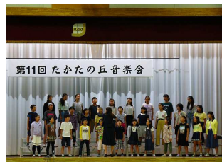
震災曲を披露 高田東小