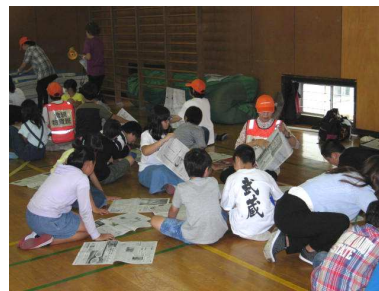
新聞紙でスリッパ作り

中高学年別に起震車による地震体験、煙の中の避難体験、防災備蓄材の学習をしました。