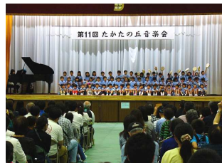
可愛い光明幼稚園児

子供達の出番では保護者や友達がスマホで録画しながら聴き入っていました。昨年より多い500席が用意されましたが満席となりました。