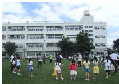
7/10 高田東小学校の練習