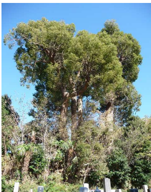
興禅寺のクスノキ

私達は興禅寺の墓地の中に立つ楠の木です。樹齢は120年ほどで、並んで立つ仲間達は同級生です。