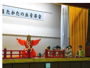
伝統の興禅寺雅楽会

雅楽、幼稚園児の可愛い歌声、2校の小学生の澄み渡るコーラス。大学のビックバンドによるジャズ。中学生のブラスバンドと実に多彩でした。そして合間合間は昔懐かしい曲、子供向けの曲、ムード溢れる曲などをサックスグループが聞かせてくれました。