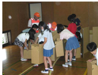
段ボールベット組み立て