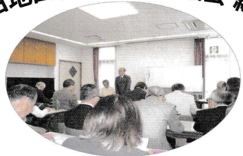
(4 月 30 日 高田地域ケアプラザにて)