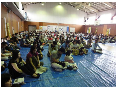
高田東小学校体育館に避難

体育館に集まった保護者は、蒸し暑い中を実際の避難の様子ビデオを視聴し、防災拠点委員による食料物資や救援救護の説明を熱心に聞かれています。大阪府北部地震が起きたばかりであり、土曜参観も併せて行っていることにより、避難訓練には児童と保護者を合わせて580名となる多くの方が参加されました。