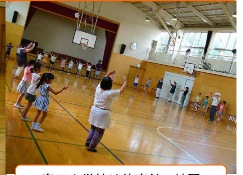
高田小学校は体育館で練習