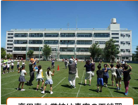
高田東小学校は青空の下練習