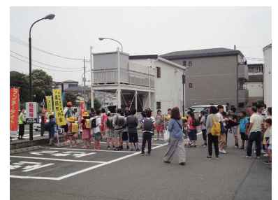
「いつき避難場所」に集合

児童は普段の登校時と違って保護者と“いつき避難場所”へ集まり、“避難者カード”に記入しました。その後、町会旗を先頭に、隊列が間延びしたり、駆け足しないように注意しながら地域防災拠点に移動しました。保護者は児童