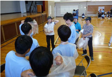
レジ袋を使って緊急対処