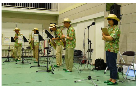
ザ・ハッピーサクセス

第1部では昨年までなかった雅楽が披露され、第2部では高田東小学校と高田小学校の合唱に加え、光明幼稚園児による可愛い歌を聞かせていただきました。第3部は慶応大学K.M.Pによるジャズと高田中学校吹奏楽部による演奏です。