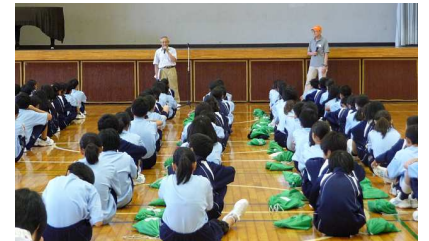
体育館で説明を聞く生徒たち

高田中学校実施計画では「防災意識を高め、地域の一員として、体験を通し互助扶助の方法を学ぶ」ことを目的に、地域の防災関係者と一緒になって実施されました。「地域と学校が一体となつての訓練は横浜市では珍しい」(港北消防署高田消防出張所坂詰所長談)とのことです。