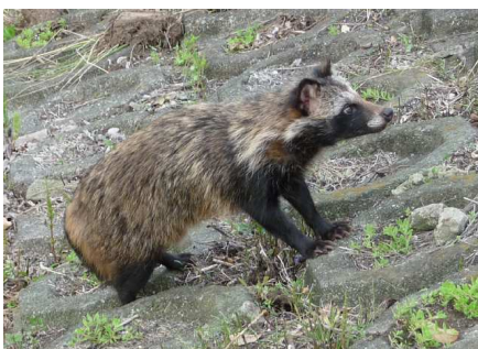
早淵川に現れたタヌキ