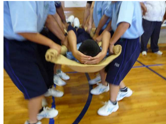
毛布で負傷者運搬