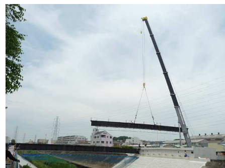
高田橋近くに建設中の橋

完成すると第三京浜都筑インターや新横浜へのアクセスなどで交通量が大きく変化するものと思われます。